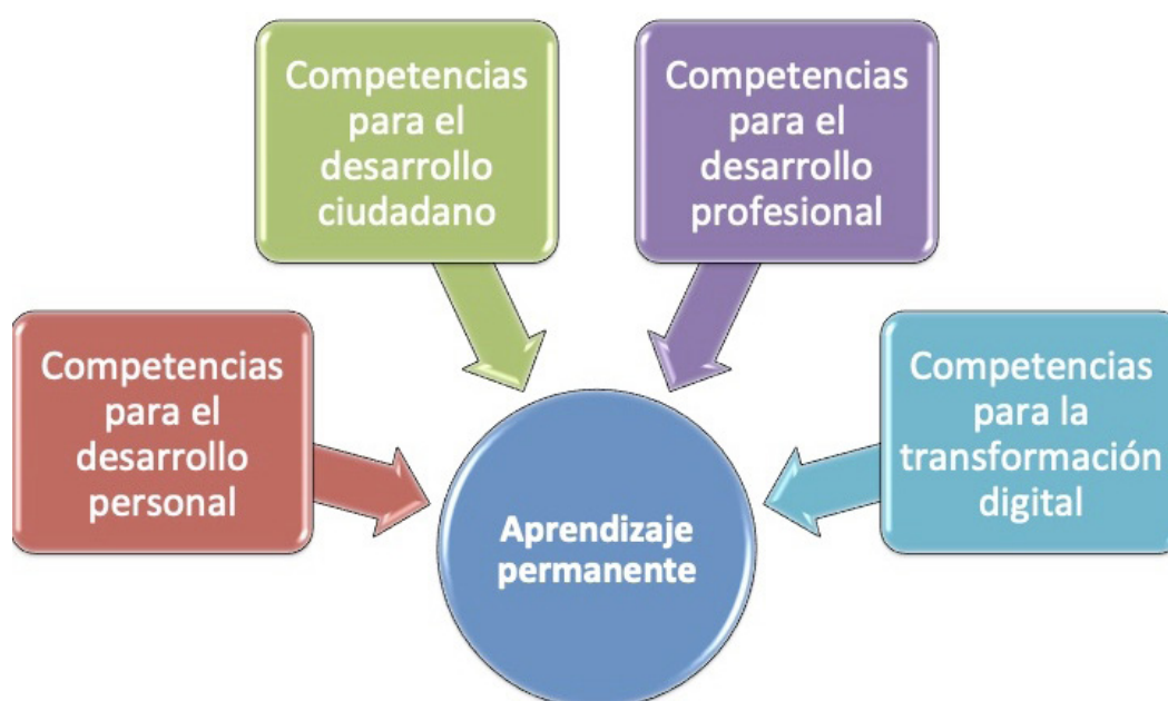
FIGURA 2. COMPETENCIAS DEL EMPLEADO PÚBLICO EN UNA ADMINISTRACIÓN DIGITAL

Así pues, la nueva identidad del empleado público trasciende las competencias de la administración pública tradicional para incorporar una visión global de la persona que realiza una función pública. Esta visión se concreta, a la vista del análisis presentado en este artículo, en cinco competencias que representan cinco líneas de desarrollo integral para el empleado público (Figura 2):