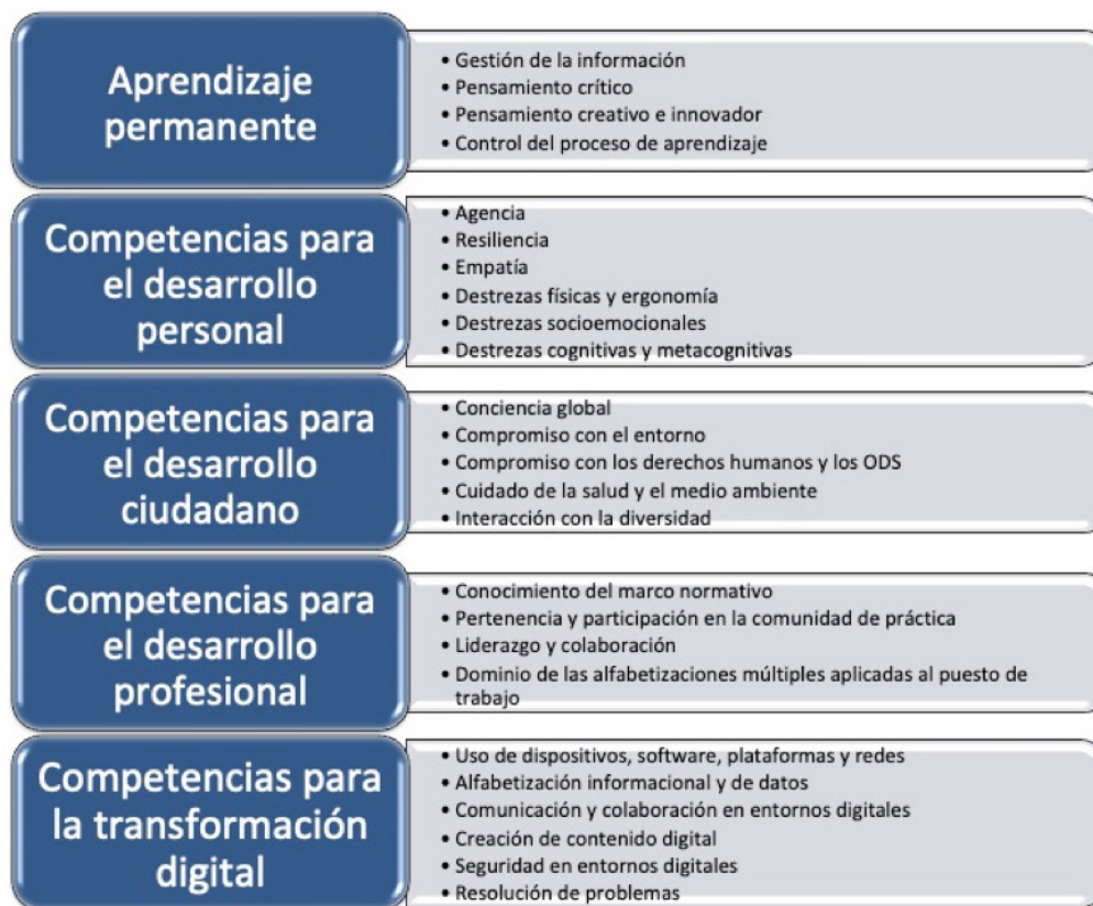
FIGURA 3. COMPETENCIAS Y FUNCIONES DEL EMPLEADO PÚBLICO EN UNA ADMINISTRACIÓN DIGITAL