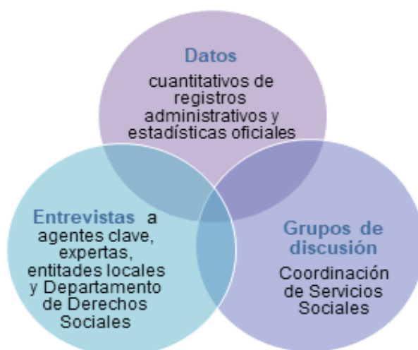
FIGURA 1. TÉCNICAS UTILIZADAS EN LA EVALUACIÓN

Como ejemplifica la Figura 1, el contraste busca cuáles son las constataciones coincidentes entre las diferentes fuentes (triangulación de información), asumiendo que una hipótesis validada por diversas técnicas o fuentes de información tiene más validez que una hipótesis contrastada sólo por una vía de información. En el anexo metodológico se detalla más extensamente estas cuestiones.