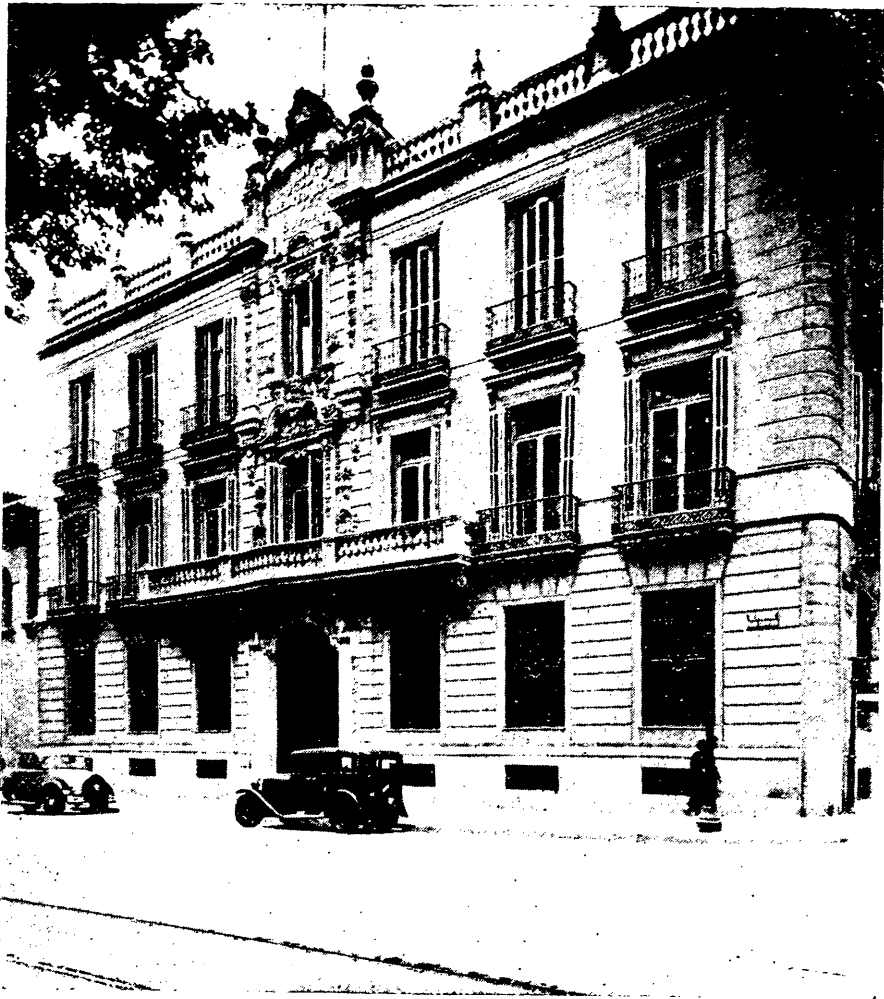
Edificio social, propiedad del Banco