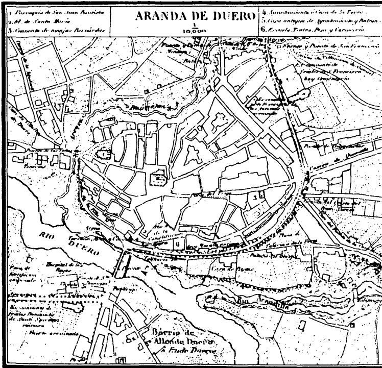
Plano de Aranda fechado en 1868.

El porvenir de Aranda parece asegurado. El «polígono de descongestión de Madrid» fue transformado, por acuerdo del Consejo de Ministros, en zona de «preferente localización industrial». Por este derrotero Aranda avanza con paso firme hacia un futuro prometedor.